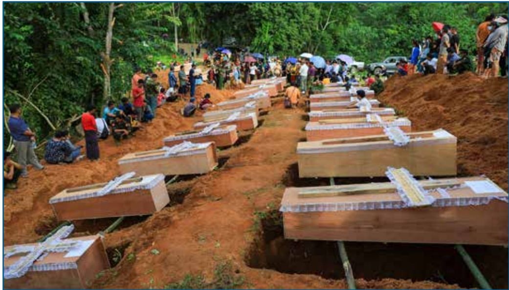
စစ်အာဏာရှင်တို့၏ ကြောက်မက်ဖွယ် တိုက်ခိုက်မှုအတွင်း မုန်လိုင်ခတ်စခန်းမှ ကလေး ၁၁ ဦး အပါဝင် သေဆုံးသွားသူ ၂၉ ဦး၏ ဈာပန အခမ်းအနား။

SAC-M မှ ၎င်းတို့၏ အစီရင်ခံစာမှ ဆက်လက်၍ ထောက်ပြသည်မှာ UN အဖွဲ့အစည်းများအနေဖြင့် စစ်အာဏာရှင်တို့နှင့် နားလည်မှုစာချွန်လွှာ လက်မှတ်ရေးထိုး ထားသော်လည်း အရေးပေါ်အကူအညီများ လိုအပ်နေသည့် ပြည်သူလူထုအား ကူညီ ခွင့်မရဘဲဖြစ်ကြရသည်။ အစီရင်ခံစာက မကြာသေးမီက တိုက်ခတ်ခဲ့သည့် မုန်တိုင်းကို သာဓက ပြခဲ့သည်။ “မိုခါမုန်တိုင်းသည် မေလ ၁၄ ရက်နေ့တွင် မြန်မာနိုင်ငံအနောက် ပိုင်းသို့ ဝင်ရောက်ခဲ့ပြီး အပျက်အစီးများပြားခဲ့သည်။ မုန်တိုင်းကြောင့် လူ ၅ သန်းခွဲ ဒုက္ခရောက်ခဲ့သည်။ OCHA အနေဖြင့် ထိခိုက်မှုအများဆုံးဖြစ်ခဲ့သည့် ပြည်နယ် ၅ ခုရှိ လူဦးရေ ၁.၆ သန်းအား အကူအညီပေးရန် တောင်းဆိုခဲ့သော်လည်း စစ်အာဏာရှင်တို့ က UN နှင့် နိုင်ငံတကာ လူသားချင်းစာနာမှုအကူအညီပေးသည့်အဖွဲ့များအား မုန်တိုင်း ကြောင့် ထိခိုက်ခဲ့သည့် ဒေသများအား သွားရောက် အကူအညီပေးရန် ငြင်းဆိုခဲ့သည်။” ၃၇