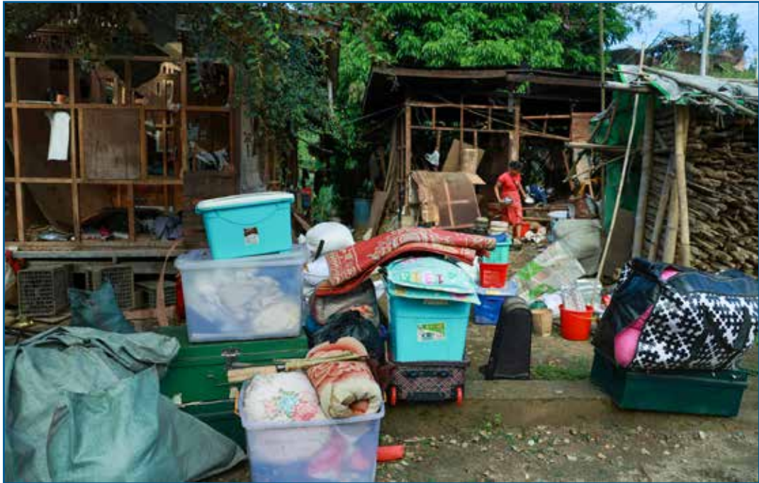
စစ်အာဏာရှင်တို့၏ တိုက်ခိုက်မှုအပြီး IDP များ လွတ်မြောက်ရာသို့ ထပ်မံပြောင်းရွှေ့ရပြန်သည်။

ကြိမ်ပစ်ခံရခဲ့တယ်။ အခုတော့ ကျမတို့ ဝေဂျောင် စခန်းမှာ ယာယီနေထိုင်ရတယ်။ ကျမတို့ဆန်ကို HPA က ရတယ် ဟင်းဖိုး လူတယောက် တနေ့ ၅ ယွမ်ရ တယ် (မြန်မာငွေ ၂၀၀၀ ကျပ်ခန့်နှင့် အမေရိကန်ဒေါ်လာ ၀.၆၈ ခန့်)။ ကျမ ဘာမှ မလိုချင်ဘူး လုံခြုံ စိတ်ချ တဲ့ ယာယီနေရာမှာ အသက်ရှင်ဖို့ လုံလောက်ရုံလေးရရင် တော်ပါပြီ။ ဝေဂျောင် စခန်းကို ပြောင်းရွှေ့ခဲ့ရပေမယ့်လည်း မုန်လိုင်ခတ်စခန်းလို တိုက်ခိုက်ခံရမှုကို စိုးရိမ်နေကြတယ်။