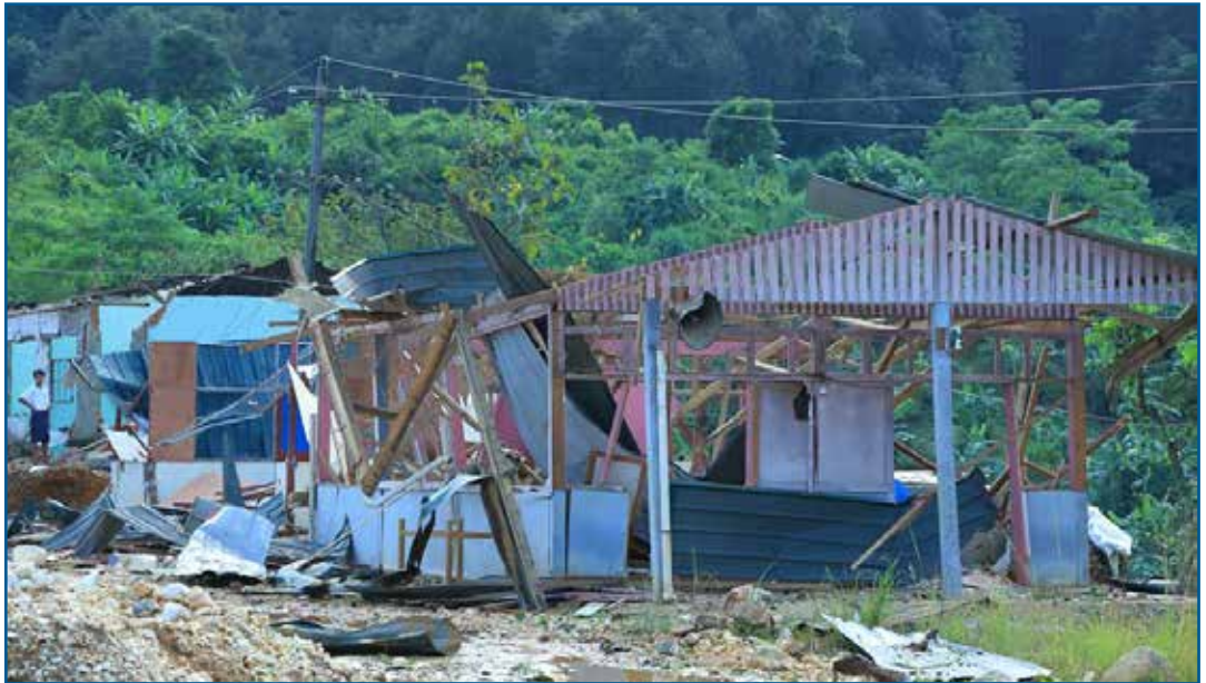
စစ်အာဏာရှင်တပ်မှ တိုက်ခိုက်ပြီးနောက် အကြီးအကျယ်ပျက်စီးသွားသည့် မုန်လိုင်ခတ် စခန်းမှ နေအိမ်များ။