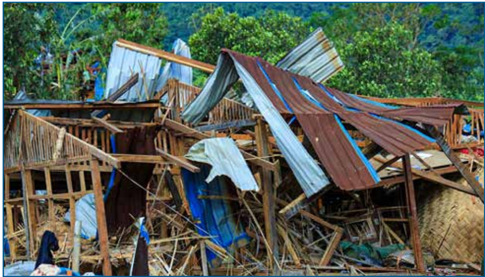
မုန်လိုင်ခတ် စခန်း တိုက်ခိုက်ခံရပြီးနောက် နေအိမ်များအားလုံး ပျက်စီးသွားပုံ။

“မြန်မာပြည်က အသက်သေဆုံးမှုတိုင်းဟာ ကြေကွဲစရာတွေပါ ဒါပေမယ့် လေကြောင်းတိုက်ခိုက်မှုတွေ ရွာတွေမီးရှို့တိုက်ခိုက်ခံရမှုတွေ ကနေဖြစ်လာတဲ့ ပျက်စီး ဆုံးရှုံးမှုကတော့ အထူးထိတ်လန့် တုန်လှုပ်စရာပါပဲ” ဟု ယန္တရား၏ အကြီးအကဲဖြစ် သူ နီကိုလပ် ကုမ်ဂျန် (Nicholas Koumjian) က ပြောသည်။ “ကျနော်တို့ရဲ့ သက်သေ အထောက်အထားတွေအရ စစ်ရာဇဝတ်မှုနဲ့ လူသားမျိုးနွယ်အပေါ်ကျူးလွန်တဲ့ပြစ်မှု တွေ မယုံနိုင်စရာ များပြားလာတာနဲ့အတူ အရပ်သားတွေအပေါ် ကျယ်ကျယ် ပြန့်ပြန့် နဲ့ စနစ်တကျ ကျူးလွန်နေတာ တွေ့ရတယ်။ ကျူးလွန် သူတိုင်းချင်း တာဝန်ခံဖို့အတွက် တ ရားစွဲဆိုတင်ပြဖို့ ကျနော်တို့ အမှုတွဲတွေ ပြင်ဆင်နေပါတယ်” ၁၆ ဟု ပြောသည်။