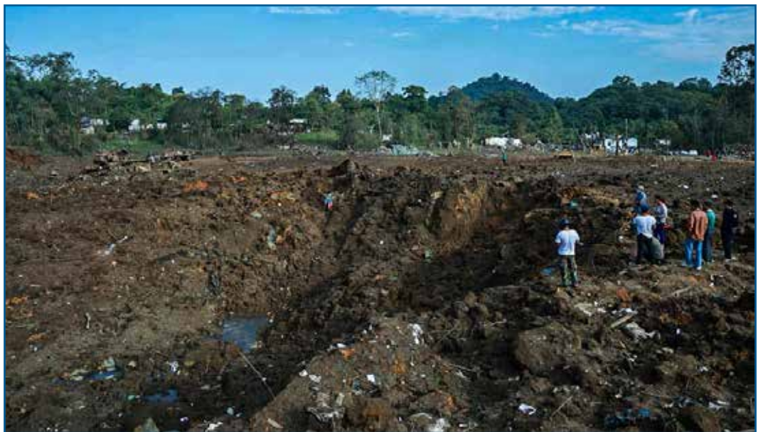
မုန်လိုင်ခတ် စခန်းတိုက်ခိုက်ခံရပြီးနောက် အကြီးအကျယ် ပျက်စီးသွားပုံ။