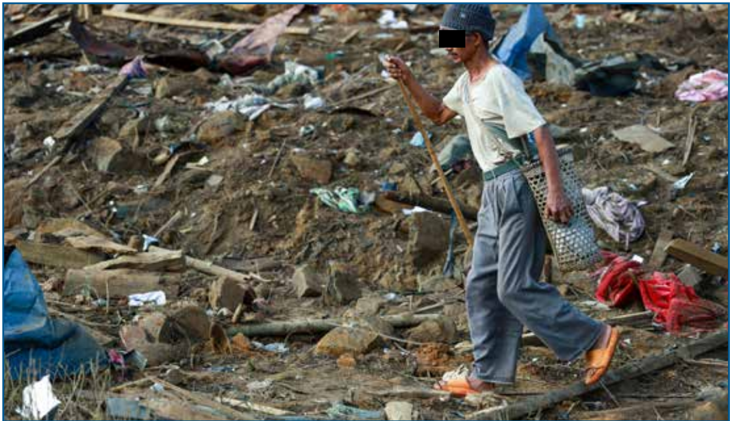
စစ်အာဏာရှင်တပ်မှ တိုက်ခိုက်ခံရပြီးနောက် အစိတ်စိတ် အမွှာမွှာ ပျက်စီးသွားသည့် နေအိမ်အား စိတ်ပျက်စွာ ကြည့်နေသည့် မုန်လိုင်ခ စခန်းမှ ၁၈၉ တစ်ဦး

ဒေသခံ ပြည်သူလူထုကပဲ သူတို့စုပေါင်းထည့်ဝင်တဲ့ငွေနဲ့ အကူအညီပေးနေရတယ်။ အာဏာသိမ်းပြီးချိန်ကတည်းက လိုင်ဇာတိုက်မှာရှိတဲ့လူသားချင်းစာနာတဲ့ အကူအညီ ပေးတဲ့ အဖွဲ့ တွေအနေနဲ့ နိုင်ငံတကာအကူအညီတွေ မရကြပါဘူး။ ကုလသမဂ္ဂအဖွဲ့ အစည်းနဲ့ အနောက်နိုင်ငံအစိုးရတွေရဲ့ လူသားချင်းစာနာတဲ့အကူအညီ တင်မဟုတ်ပါဘူး ဒီအတွက် တုန့်ပြန်ဆောင်ရွက်မှုလည်း မရှိကြပါဘူး။ သူတို့အနေနဲ့ (UN လက်အောက်ခံ အဖွဲ့အစည်းများနှင့် အနောက်နိုင်ငံအစိုးရများ) မလွဲသာလို့ စစ်ကောင်စီနဲ့ ပူးပေါင်း လုပ်ဆောင်နေရတယ် ဆိုပေမယ့် ဒေသခံ လူသားချင်းစာနာမှု အကူအညီပေးတဲ့အဖွဲ့ တွေနဲ့ ညှိနှိုင်းဆောင်ရွက်ပြီး မြေပြင်မှာ အရေးပေါ်အကူအညီတကယ်လိုအပ်သူတွေကို ကူညီပေးသင့်ပါတယ်။ UNICEF အနေနဲ့ စစ်ကောင်စီနဲ့ပေါင်းပြီး MoU ထိုးတာတွေ လည်း ကျမတို့ကြားပါတယ်။ ဒါပေမယ့် တကယ်မြေပြင်မှာ အကူအညီလိုအပ်သူတွေ အတွက် အခြေအနေပိုပြီးတော့ ဆိုးသထက် ဆိုးစေပါတယ်။ နိုင်ငံတကာ အဖွဲ့အစည်း တွေအနေနဲ့ အရေးပေါ်အကူအညီတွေ လိုအပ်နေတဲ့ပြည်သူတွေကို ကူညီဖို့ ကောင်းမွန် ပြည့်စုံတဲ့ ဗျူဟာတွေ ချမှတ်ဆောင်ရွက်သင့်ပါတယ်” ၃၁ ။